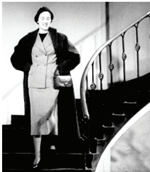
8. Modelka prezentująca płaszcz i sukienkę na międzynarodowym pokazie mody w Lipsku.

czalności polskiego przemysłu odzieżowego – poczynając od wzorów krajowych projektantów, poprzez tkaniny wyprodukowane w Polsce, a kończąc na tworzeniu gotowych kreacji w państwowych szwalniach. Częstokroć kwestię tę poruszano także w odniesieniu do tematyki szkolnictwa – w wydaniach dotyczących zdolnych dziewcząt pobierających naukę w technikach o profilach krawieckich 16 . Pokazy mody organizowały również zakłady przemysłowe, specjalizujące się w produkcji tkanin na ubrania 17 .