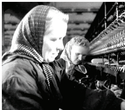
1. Pracownice Państwowego Zakładu Przemysłu Bawełnianego w Andrychowie.