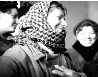
5. Tłumy kupujących przed stoiskiem z tkaninami.