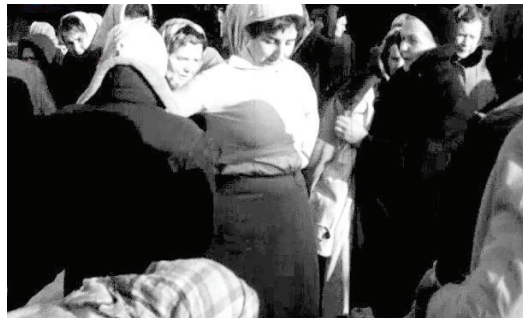
6. Kobiety przymierzające ubrania na bazarze.

na z klientek podczas pobytu w sklepie nie prezentuje podobnych kreacji – wręcz przeciwnie. W głównej mierze są to długie, ciemne, niecharakterystyczne płaszcze oraz okrywające głowy chustki. Zawarty w opisywanym materiale przekaz przekonuje, że kobiety mają wpływ na produkowane na tkaninach desenie. Zgodnie z przytoczoną dewizą „Konsument decyduje o produkcji”, nabywczynie wypełniają ankietę, w której opisują swoje spostrzeżenia dotyczące wzorniczych życzeń. W podobnym tonie zrealizowane zostało rów-