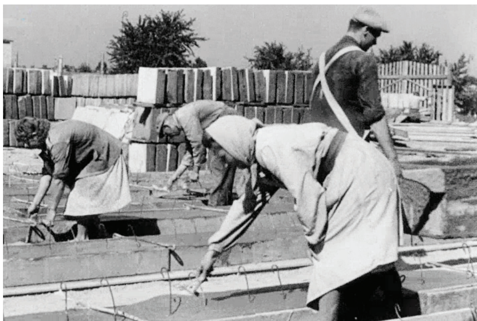
2. Kobiety pracujące przy budowie szybkościowca w Warszawie (wg Słownika języka polskiego PWN szybkościowiec to „budynek, którego budowa trwała rekordowo krótko”).

– niemożliwe jest jednoznaczne opisanie wyglądu prezentowanych kreacji. Pewne jest jednak, że ubiór kobiet odznacza się głównie skromnością i brakiem jakichkolwiek ekstrawagancji.