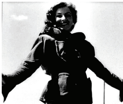
7. Pokaz mody damskiej Państwowego Domu Towarowego we Wrocławiu.