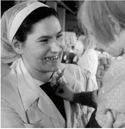
3. Wizyta przedszkolaków u mam pracujących w Zakładach Przemysłu Cukierniczego 22 Lipca (znacjonalizowane w 1945 r. przedsiębiorstwo Fabryki Czekolad E. Wedel).